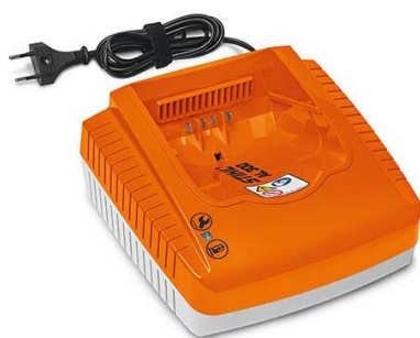
Cargador rápido AL 300

Eficiente Motor EC de STIHL, sin mantenimiento, sin escobillas, garantiza una larga vida útil y mayor tiempo de funcionamiento de la máquina. Control electrónico del motor a través del nuevo motor STIHL EC. Regula la carga a cortar ramas gruesas y se reajusta, el número de ciclos es constante durante el corte. Se consigue un buen rendimiento.